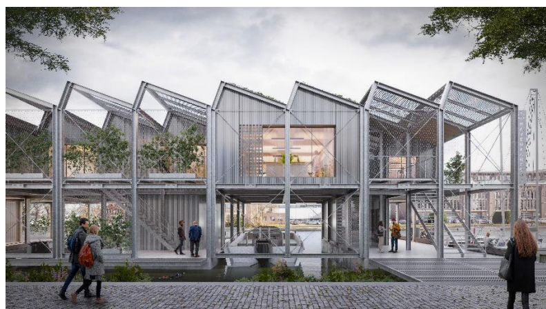
Werktuig voor de verbeelding