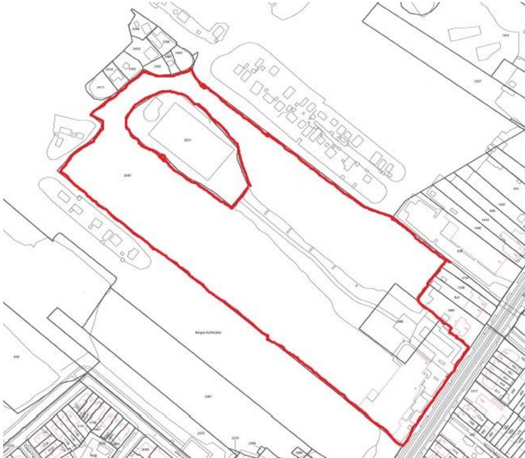
Kadastrale begrenzing (in rood) projectlocatie