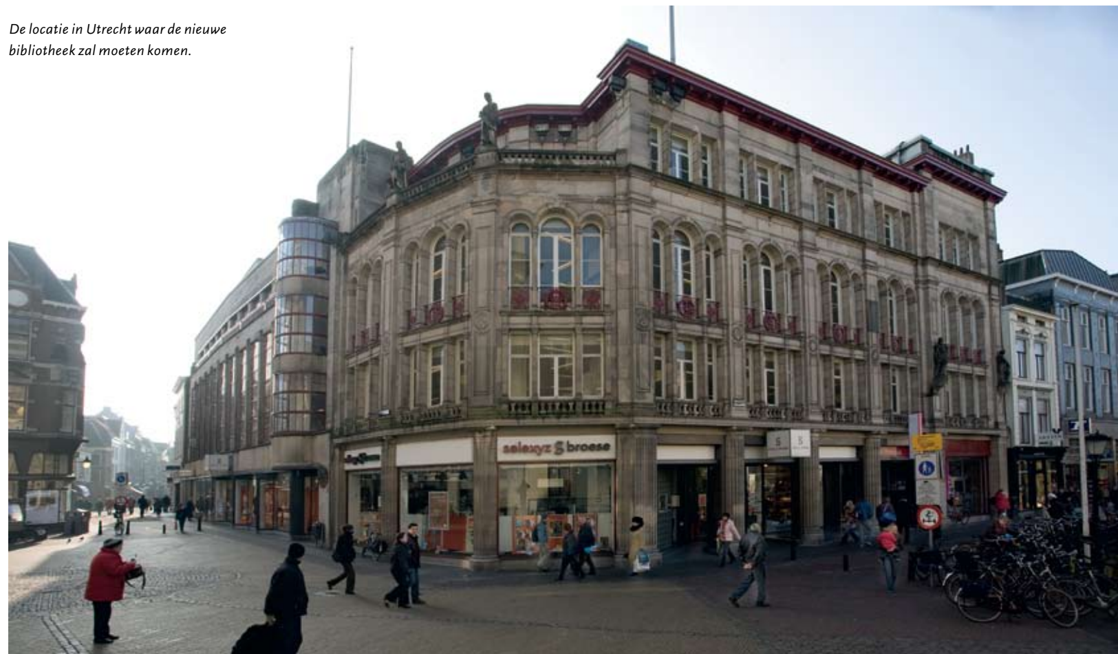
De locatie in Utrecht waar de nieuwe bibliotheek zal moeten komen.