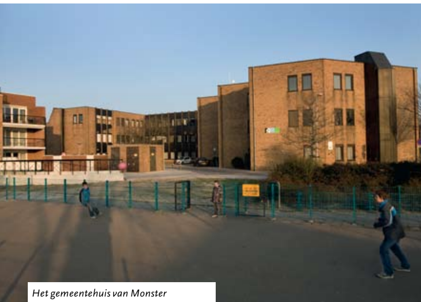
Het gemeentehuis van Maastricht