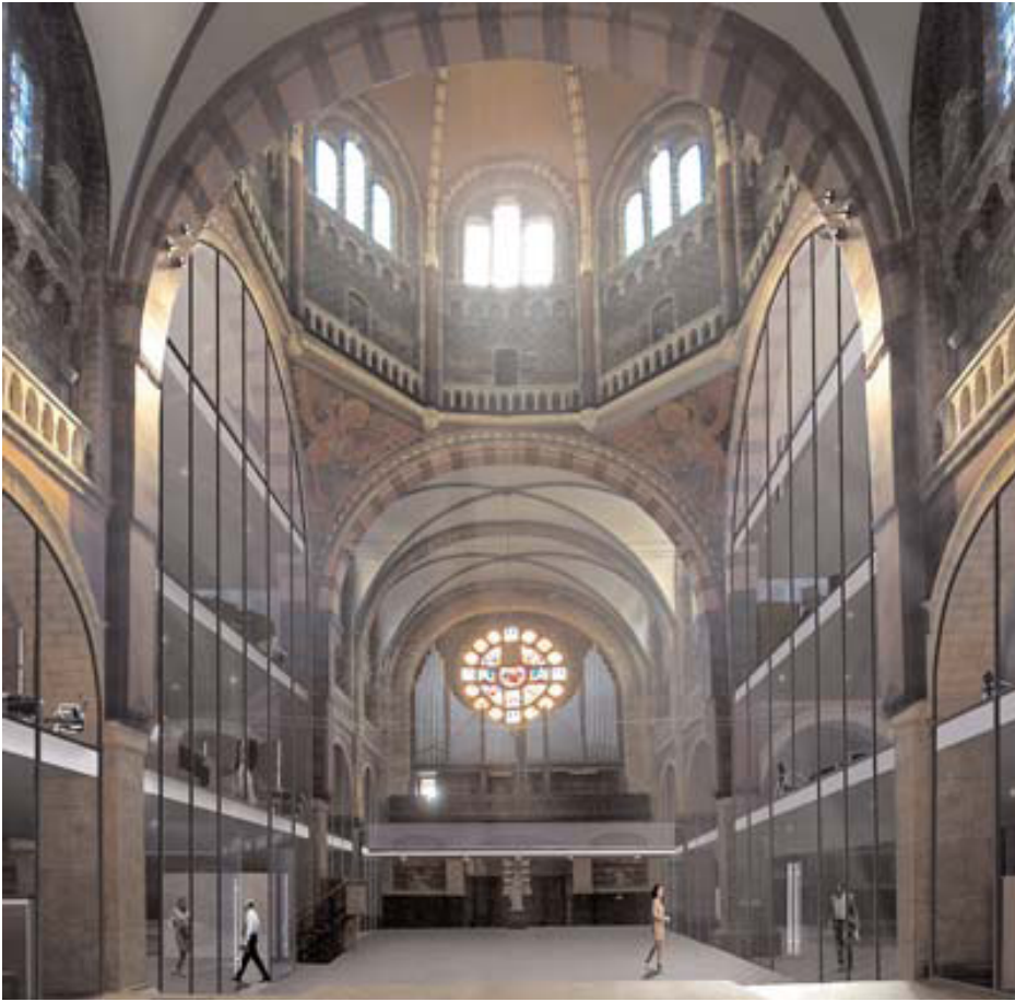
Animatietekening van het toekomstige interieur van de Lambertuskerk met kantoorfunctie van de woningstichting Servatius (tekening 2006 architectenbureau Boosten Rats).

architect Jan van Groenendael, die in dit werk de barokke plattegrond van de St. Pieter in Rome combineerde met de Romaans-Byzantijnse vormgeving van de Parijse Sacré-Coeur, die twee jaar eerder was voltooid. Helaas heeft de instabiele ondergrond van het voormalige vestingterrein indirect ook het verval van de kerk veroorzaakt en voor de stabilisatie van de kerk is nu een extra inspanning vereist. De gemeente heeft al twee ton uitgegeven voor noodherstel aan de kerk, zodat wind en water geen directe bedreiging meer vormen en ook is er een nieuwe bestemming voor de kerk gevonden. De gemeente heeft vijf jaar geleden voor