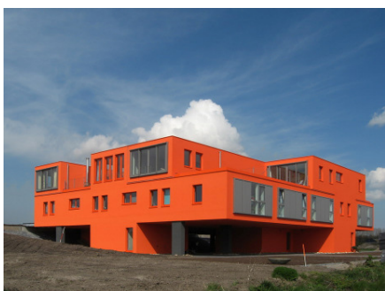
Vereniging KaveL met Villa van Vijven in Almere