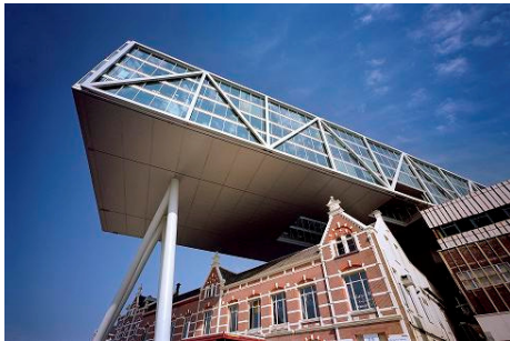
Unilever bv met De Brug/De Kade, het hoofdkantoor van Unilever voor de Benelux, in Rotterdam