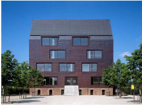
VIA Projectontwikkeling bv met Huis de Wiers in Nieuwegein