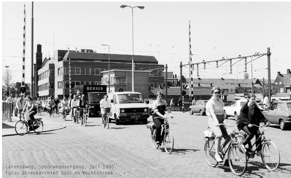
Larenseweg, Spoorwegovergang, juli 1980.

Met Hilversum als uitgangspunt kijkt Museum Hilversum met de reeks architectuurdebatten 2008 verder dan de gemeentegrenzen. Thema's die in Hilversum actueel zijn, worden vergeleken en kritisch gemeten aan ontwikkelingen elders in Nederland. Maar ook: de plannen in Hilversum staan niet los van een regionale context. Alle debatten staan onder leiding van Jord den Hollander (architect en filmmaker).