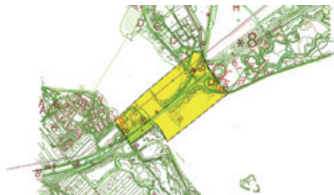
Figuur 1 Overzicht plangebied

In het plangebied (zie figuur 1) en de directe omgeving daarvan zijn ook andere planvormingsprocessen gaande. Allereerst is dat de planstudie Schiphol-Amsterdam-Almere, die mede aanleiding is voor de prijsvraag en vooral van belang voor de opgave voor wat betreft de voorgenomen verbreding van de A6. In het verlengde van deze studie ontwikkelen Rijkswaterstaat, gemeente Almere, provincie Flevoland en Staatsbosbeheer onder de paraplu van een Stuurgroep A6-zone plannen voor de inpassing van de A6 in Almere. Deze studie 'Inrichting A6-zone' kent een aantal deelprojecten, waarvan deze opgave er één is. Aan Naardense zijde spelen op dit moment geen andere ontwikkelingen dan de verbreding van de A6.