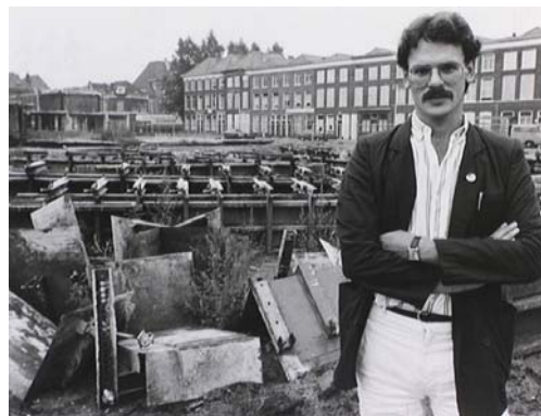
1982 Nieuwe woningen in aanbouw in de Van Dijkstraat, Den Haag.