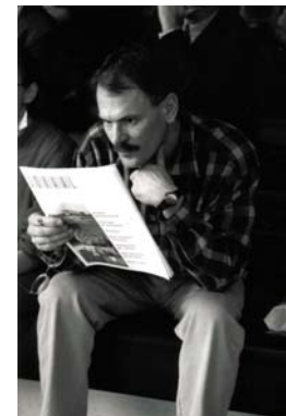
1993 Medeoprichter Architectuur Lokaal .

De Werkgroep 5x5 hief zichzelf in 1989 op. De eerste architectuurnota van het rijk, Ruimte voor architectuur (1991), was in deze periode in voorbereiding. De nota is gebaseerd op hetgeen er indertijd leefde in de samenleving; de verworvenheden van 5x5 hebben daaraan een bijdrage geleverd. De nota schiep een klimaat waarin de architectuur voor het vakgebied én voor publiek werd gestimuleerd. Het drieledige kwaliteitsbegrip van architectuur, waar de drie onderdelen gebruikswaarde, toekomstwaarde en belevingswaarde in evenwicht zijn, werd in de architectuurnota opgenomen en wordt nog steeds algemeen gehanteerd.