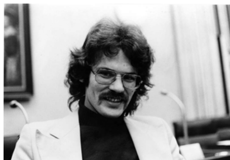
1975-1980 Lid gemeenteraad Den Haag.

Op 25-jarige leeftijd werd hij lid van de gemeenteraad van Den Haag en bracht hij, in deze periode van kaalslag in de steden, zijn eerste ontwerpnota uit. Hij richtte zich daarin op de stadsvernieuwing als tegenhanger van de toenmalige cityvorming . Hij ging in op de vraag, in welke gebieden