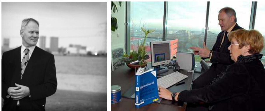
2006 - heden Wethouder Ruimtelijke Ordening Almere (links burgemeester Annemarie Jorritsma).

hun huis te slopen. Bij huurwoningen is dat anders. Daar zijn het niet de huurders die beslissen. Zij zijn afhankelijk van andere, niet democratisch controleerbare machten. (...) Denken vanuit het perspectief van de bewoners, wil zeggen dat bewoners in staat moeten worden gesteld om hun eigen plannen te maken. Met of zonder de woningcorporatie.(...) Anders gezegd, waar instituties geen mogelijkheden meer zien de belangen van de bewoners te verdedigen, moeten bewoners in staat worden gesteld zelf het initiatief ter hand te nemen. En dan is het particulier opdrachtgeverschap een reëel alternatief. 26