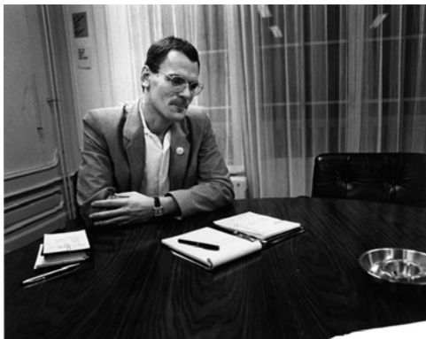
1980-1989 Wethouder Stadsvernieuwing en Ruimtelijke Ordening van Den Haag.