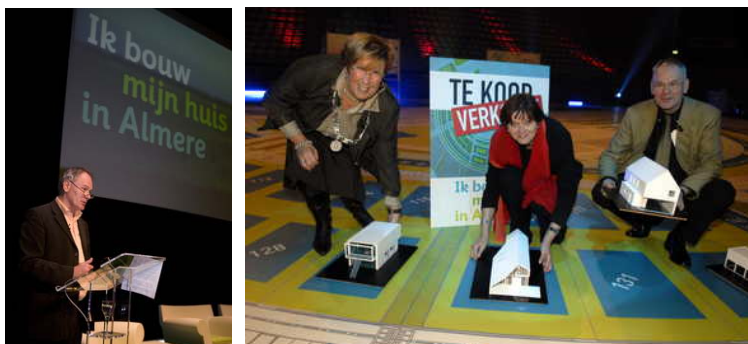
2007 Manifestatie Ik bouw mijn huis in Almere (met burgemeester Annemarie Jorritsma en minister Ella Vogelaar).