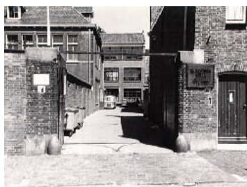
RK LTS St. Joseph, Den Haag.