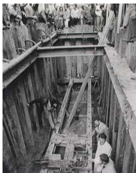
1985 Duivesteijn sluit het riool onder de Van Ostadestraat aan op het hoofdriool aan De Vaillantlaan in Den Haag, ontwerp Jo Coenen.