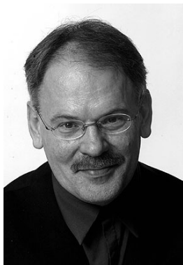
1994 - 2006 Lid Tweede Kamer voor de PvdA.