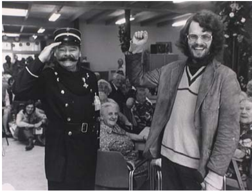
1975 Opening Dienstencentrum Om en Bij.

stadsvernieuwing zou moeten plaatsvinden, wat voor gemeentelijke organisatie daarvoor moest worden opgericht en hoe de bevolking bij de stadsvernieuwing moest worden betrokken. 'Het is nodig dat er een brede discussie ontstaat in bewonersorganisaties en politieke partijen.' 3 In aansluiting op zijn raadslidmaatschap werd hij vijf jaar later wethouder ruimtelijke ordening en stadsvernieuwing van Den Haag voor een periode van tien jaar (tot 1989). Hij zette zich daarbij sterk in voor betaalbare volkshuisvesting van goede kwaliteit.