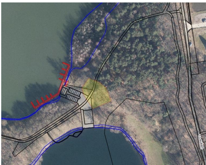
Plangebied. In geel het zoekgebied voor het paviljoen, hieronder met de rode cirkel een tweede impressie van het gebied.

Het zoekgebied voor het te realiseren horecapunt is circa 1.200 m 2 (zie afbeelding hiernaast). Hiermee willen wij ruimte geven voor een optimaal gebruik van het landschap. En rekening houden met de diverse wensen zoals verderop in deze paragraaf geformuleerd. Het terras van het horecapunt valt in het zoekgebied. Verder kunnen wij ons voorstellen dat gebruikers van het horecapunt gebruikmaken van het plateau behorende bij twee trappen die daar zijn gerealiseerd. Dit is openbaar gebied en moet dat ook blijven.